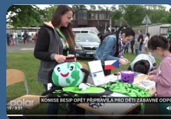
KOMISE BESIP OPĚT PŘIPRAVILA PRO DĚTI ZÁBAVNÉ ODPOLEDNE