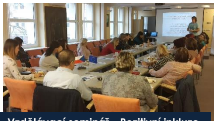
Vzdělávací seminář – Pozitivní inkluze, 23.11.2018, Městská knihovna Havířov