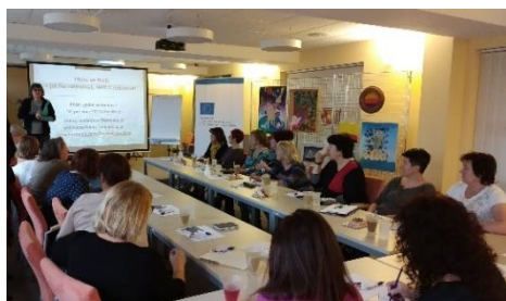
Vzdělávací seminář – Lhaní ve škole 18.12.2018, Městská knihovna Havířov